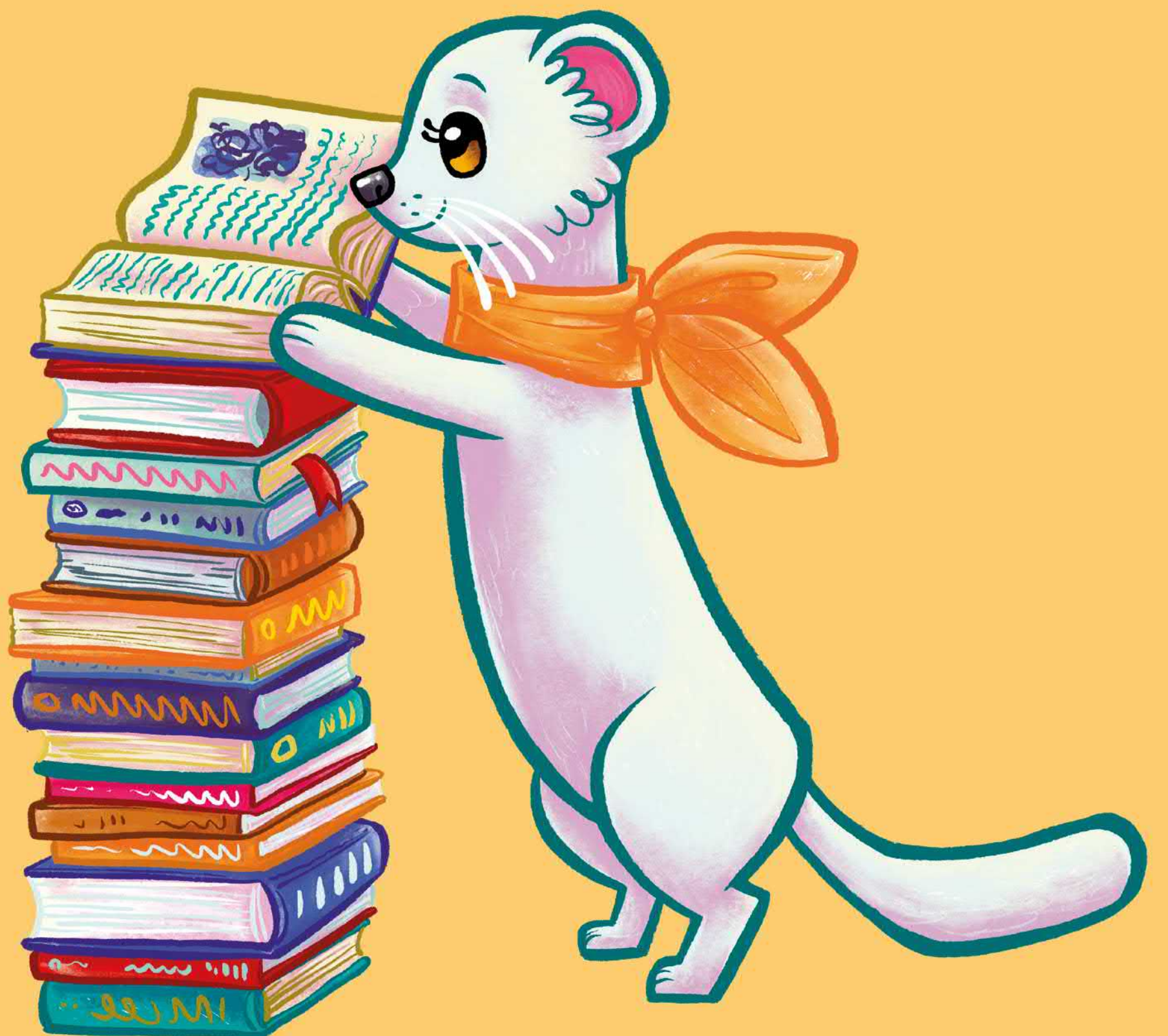
Illustration: Apila Pepita Miettinen

Översättning: Riikka Ilander och Catharina Latvala